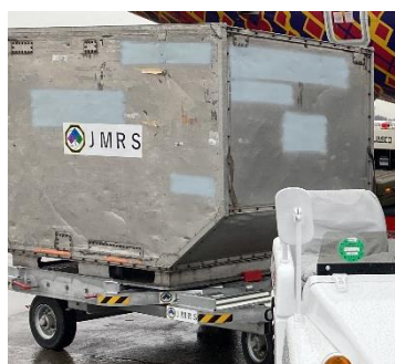
コンテナドリー+ULDコンテナ

その他にもGPU、エアコンユニット、パッセージャーステップ等も準備していきます。