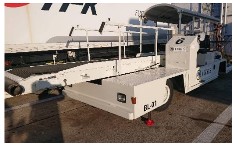
ベルトローダー2台