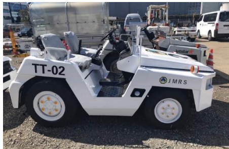
TT車（トローイングトラクター）3台