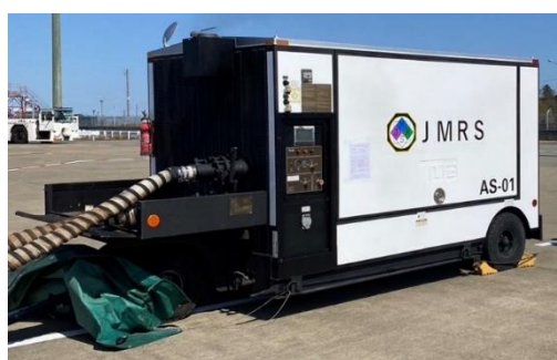
ASU(エアースターターユニット)