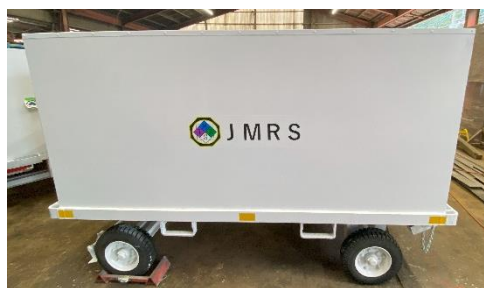
バルクカート6台 又はコンテナドリー+ULDセット